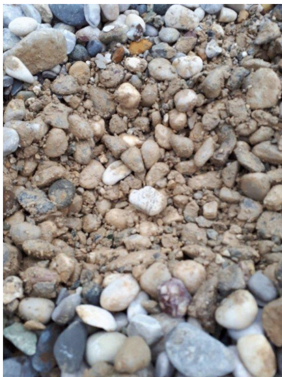
Slika 3: Neprimeren material