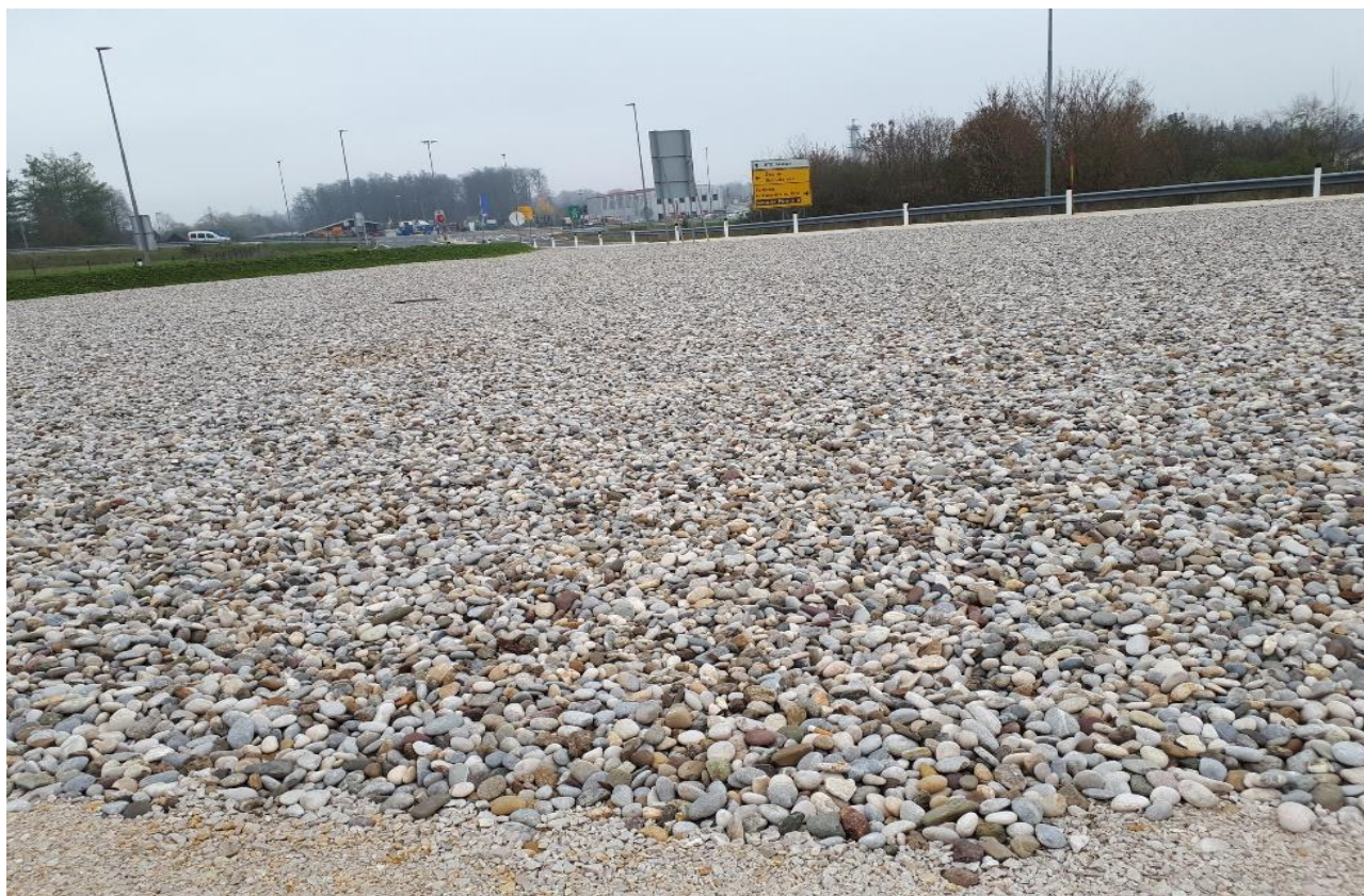
Slika 1: Primer izdelane izletne cone