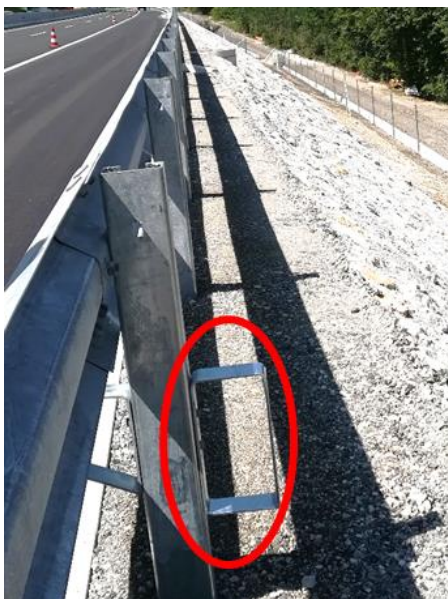
Slika 1: Stopa za prehod čez jekleno varnostno ograjo

b) Elementi za prehod preko jeklene varnostne ograje, ki niso njen sestavni del