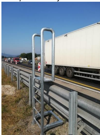
Slika 3: Lestev za prehod čez jekleno varnostno ograjo

Na lokacijah cestnih objektov, SPIS portalov in podobnih mestih, kjer se pogosto opravljajo vzdrževalna dela in je postavljena jeklena varnostna ograja, ki je višja od 80 cm, se za varnostno ograjo vgradi element – lestev, in sicer tako, da ne vpliva na karakteristike varnostne ograje – ni pritrjen ali kako drugače fizično povezan z varnostno ograjo (slika 3). Element se ne namešča za varnostno ograjo, postavljeno v ločilnem pasu. Delavniški načrti prehoda – lestve za prehajanje preko JVO so podani v prilogi Navodila. Lestev se postavlja na v zemljino zabite sidrne elemente ali se vijači na betonsko konstrukcijo objekta. V primeru, da na mestu postavitve lestve potekajo podzemne inštalacije (elektrika, optika, odvodnjavanje ...) se lestev pritrdi na armiranobetonski pasovni temelj dimenzije 0,80 m x 0,30 m x 0,80 m.