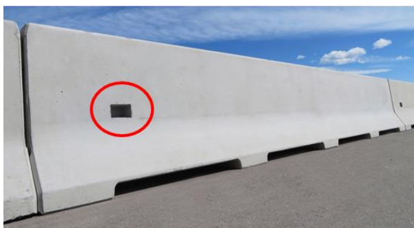
Slika 1: (levo), 1a (desno): Stopnica (utor) za lažji prehod čez ograjo

Elementi, ki omogočajo prehod čez varnostne ograje in so njen sestavni del, se za betonske varnostne ograje izvedejo, kot je prikazano na primeru na slikah 1 in 1a. Pri tem mora biti odprtina dimenzij najmanj 0,15 m x 0,12 m in globine najmanj 0,12 m izvedena obojestransko.